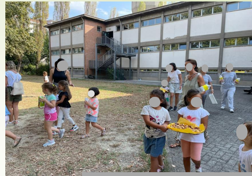
merenda di benvenuto