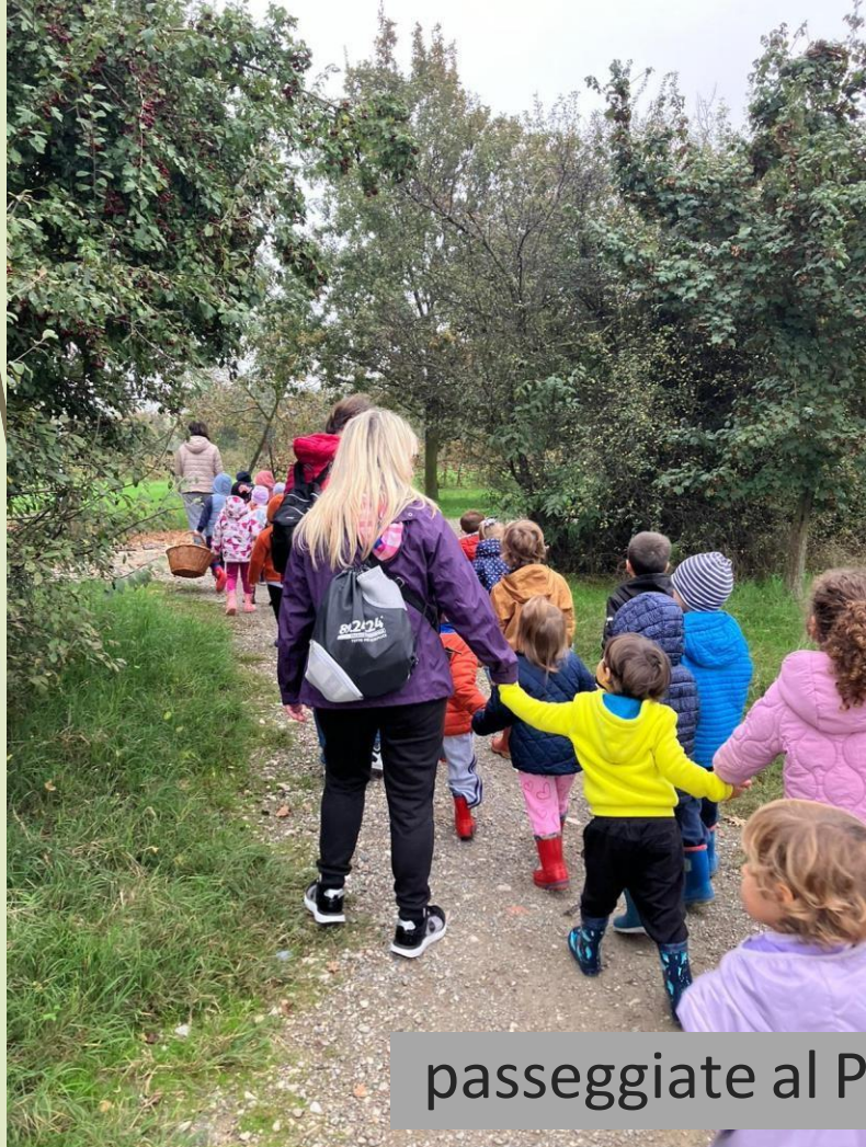
passeggiate al Parco della Resistenza